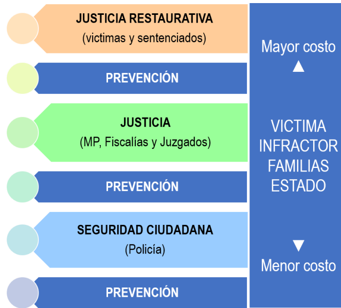
Ilustración 1. Edificio de seguridad-justicia-justicia restaurativa.