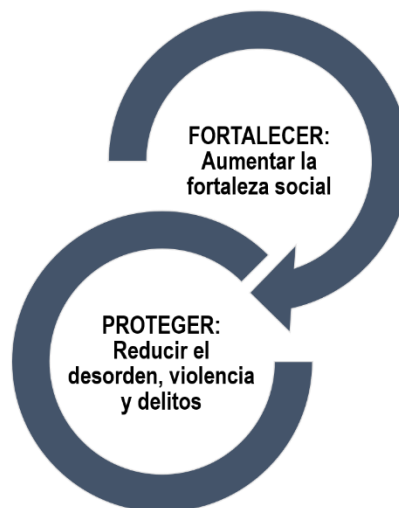
Ilustración 2. Acciones de la política de prevención: Proteger y Fortalecer.

El Modelo de Prevención Quintana Roo propone que, además de proteger a las personas, es necesario que la política de prevención desarrolle capacidades individuales y comunitarias, por medio de información y herramientas para desarrollar hábitos seguros, desalentar conductas de riesgo y aumentar su resistencia a involucrarse en actos violentos e ilegales.