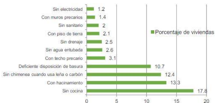
Gráfica 4.9 Principales rezagos en las viviendas de la entidad 2015

La entidad registró durante 2016 un millón 501 mil 562 personas y 441 mil 200 viviendas, en las cuales la carencia de cocina es el principal rezago en la vivienda, seguida del hacinamiento, la carencia de chimenea cuando se usa leña o carbón, techo precario, falta de agua entubada, drenaje, piso de tierra, carencia de sanitario, muros precarios y falta de acceso a la electricidad.