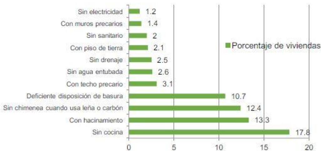
Gráfica 4.9 Principales rezagos en las viviendas de la entidad 2015

La entidad registró durante 2016 un millón 501 mil 562 personas y 441 mil 200 viviendas, en las cuales la carencia de cocina es el principal rezago en la vivienda, seguida del hacinamiento, la carencia de chimenea cuando se usa leña o carbón, techo precario, falta de agua entubada, drenaje, piso de tierra, carencia de sanitario, muros precarios y falta de acceso a la electricidad.